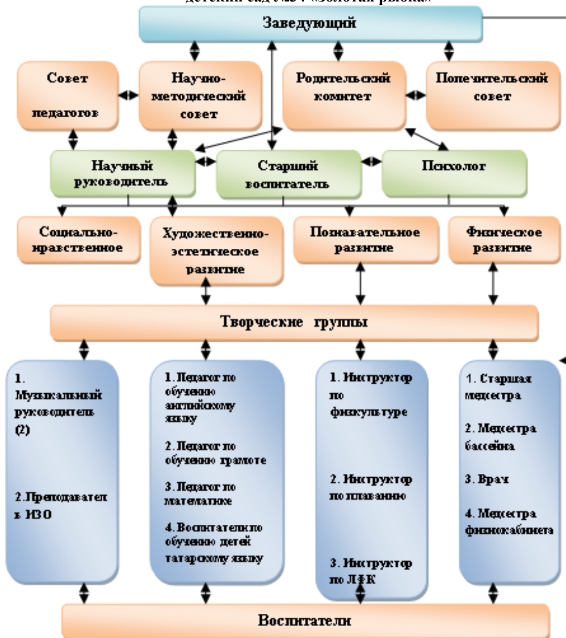
Структура управления МБДООУ «Центр развития ребенка - детский сад №34 «Золотая рыбка»

Таким образом, система управления ДООУ может быть оценена как положительная, т.к. обеспечивает стабильную работу коллектива и учреждения в целом, а также положительную динамику работы в новых условиях. По итогам 2025-2026 года система управления ДООУ оценивается как эффективная, позволяющая учесть мнение работников и всех участников образовательных отношений. В следующем году изменение системы управления не планируется.